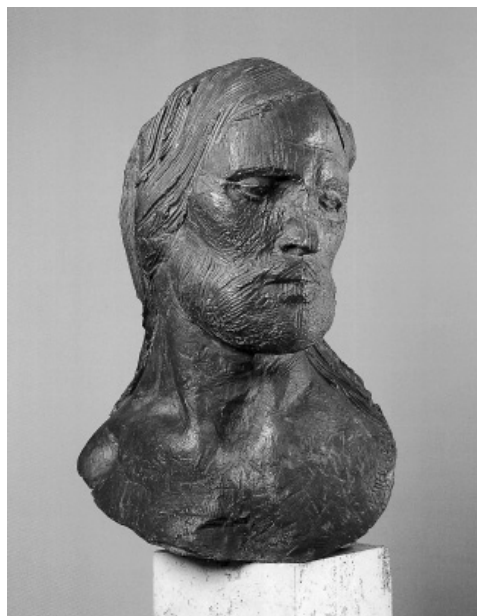
Emilio Greco (Catania 1913 - Roma 1995)

Anche l'AC locale ne è stata influenzata: in positivo (in quanto negli anni si è dotata di una struttura organizzativa propria per il collegamento col centro diocesano) e in negativo (poiché maggiore è la distanza ideale dal Centro cittadino, minore è la percezione del legame diocesano). Il calo delle adesioni soprattutto in Valle Camonica e la volontà di mostrare vicinanza alla zona più lontana della Diocesi ha portato il meeting di ACR 2003 proprio a Edolo. E' innegabile una certa crisi dell'AC sia a livello di Diocesi che a livello Nazionale. Una crisi