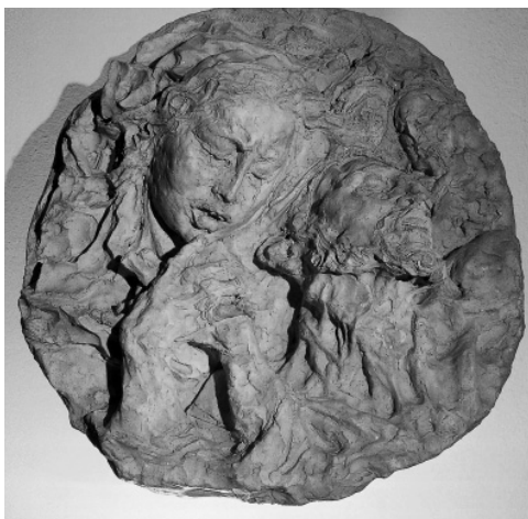
Federico Severino (Brescia 1953) Deposizione , 1991 Altorilievo in cotto, cm 53x50

In tutti questi anni si è sviluppata una forte rete di collaborazione e collegamento con gli enti pubblici (ASL, Comuni, Ospedali, Carabinieri, ecc...) e con altre associazioni locali (la Caritas Diocesana, la cooperativa "Il solco", Folonari, il Sindacato ecc...) e